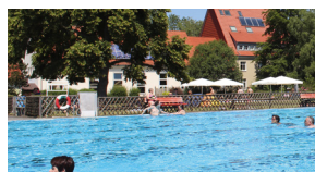
Ansicht aus dem Schwimmbecken